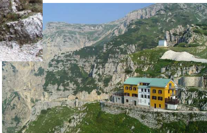
Rifugio Achille Papa

DOMENICA 13 SETTEMBRE ore 8:00 a IMBERIDO