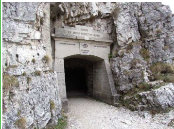
Inizio strada delle 52 gallerie